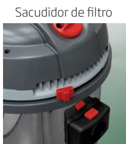
Sacudidor de filtro