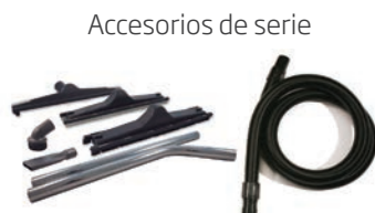
Accesorios de serie